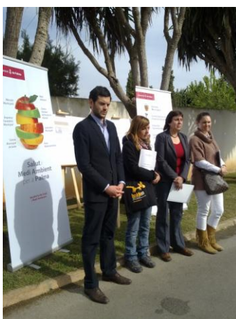
Firma convenio Son Reus

Se ha firmado un convenio con Son Reus mediante el cual se nos exime del pago de las tasas de adopción de aquellos animales que rescatamos justo antes de ser sacrificados. Gracias a este convenio las asociaciones de Baldea como Amics dels Animals de Esporles, SOS Animal, Patitas y otras asociaciones colaboradoras han podido salvar más de 400 animales.