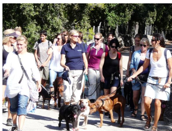
Monestario de Lluc