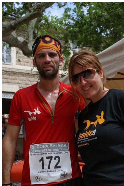
Maratón TUI 2010

Uno de nuestros voluntarios es atleta y lleva un peto con el logo de BALDEA a todas las carreras que se celebran en el circuito de montaña. También en 2010 ha participado en la exitosa maratón que organiza TUI en Palma.