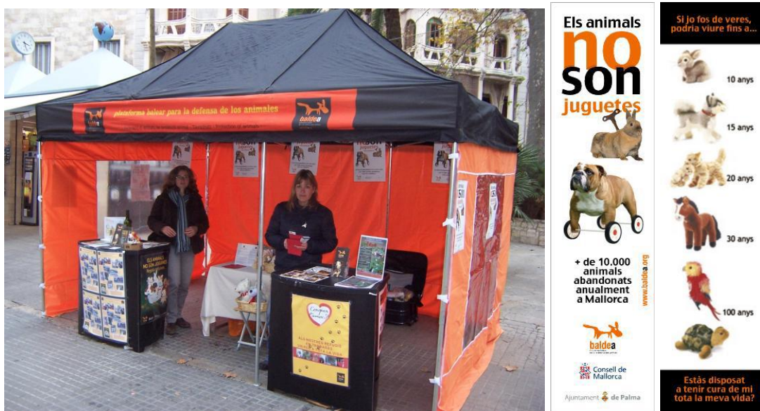
Stand con nueva carpa en Palma durante la campaña de Navidad "Los animales no son juguetes" en el que se distribuyeron puntos de libro